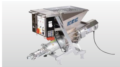
◆ MAIポンプ M400NT

※SNとは、充填式モルタル全面接着型ロックボルト工法を初めて行ったStore Norfors水力発電所(スウェーデン)の頭文字です。